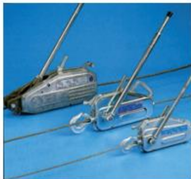
TIRFOR TU - série standard

Dans la plus pure tradition du TIRFOR, les appareils de la gamme TU offrent un service inégalable par leur durée de vie et leur robustesse. Ils sont d'ailleurs agréés pour le levage de personnes.