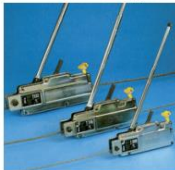
TIRFOR T500 - série légère

Compacts et plus légers, les appareils TIRFOR de la gamme T-500 allient maniabilité et sécurité.