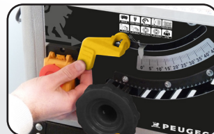
Serrage «Push and Block» «Push and block» locking