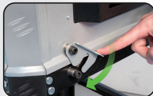
«Flash system» : séparation rapide «Flash system» : quick separation