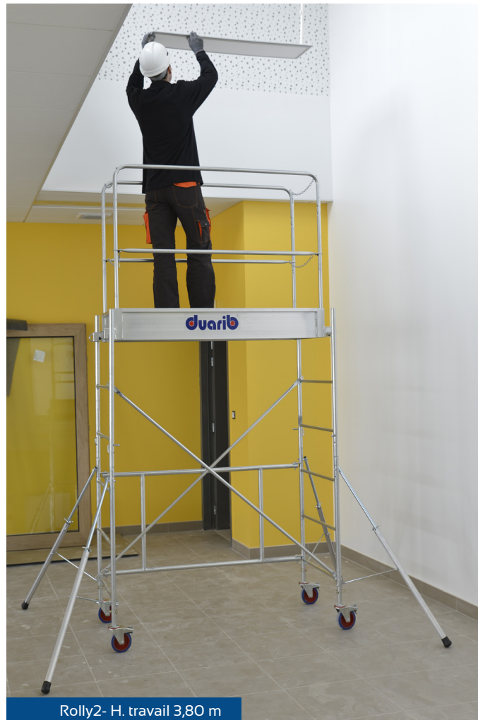
Rolly2- H. travail 3,80 m