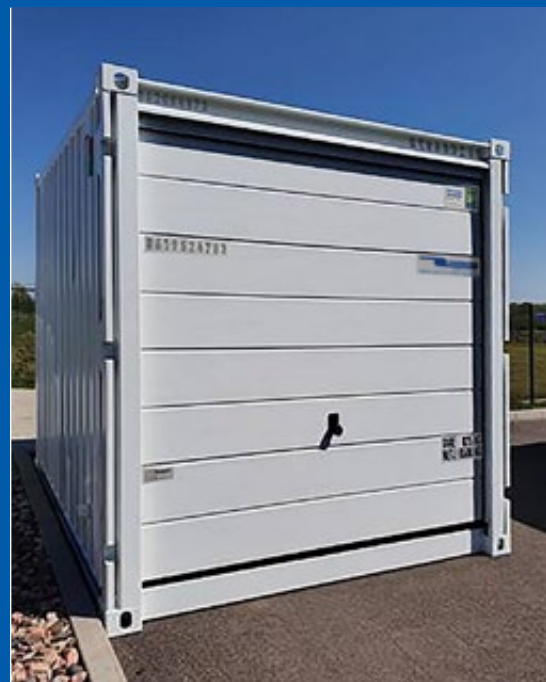
Porte de garage sectionnelle pratique