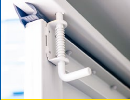
2 verrouillages internes