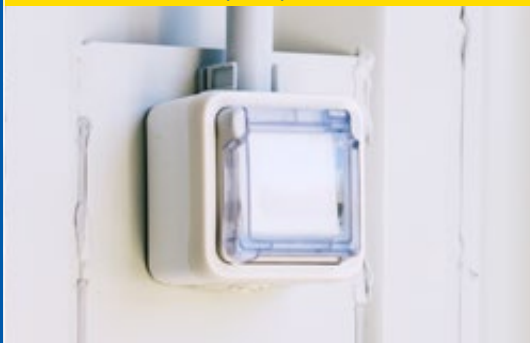
Tableau électrique avec prises intégrées